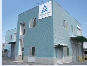
太陽光発電評価センター SEAC (Solar Energy Assessment Center)