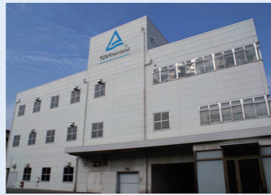
関西テクノロジーセンター KTAC (Kansai Technology Assessment Center)