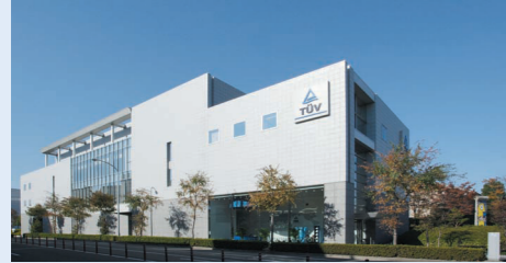
テクノロジーセンター GTAC (Global Technology Assessment Center)

テュフ ラインランド ジャパンは、国内に計5ヶ所の試験所を有します。中でもこの3つの試験所は、再生可能エネルギー関連製品を主に試験する施設です。